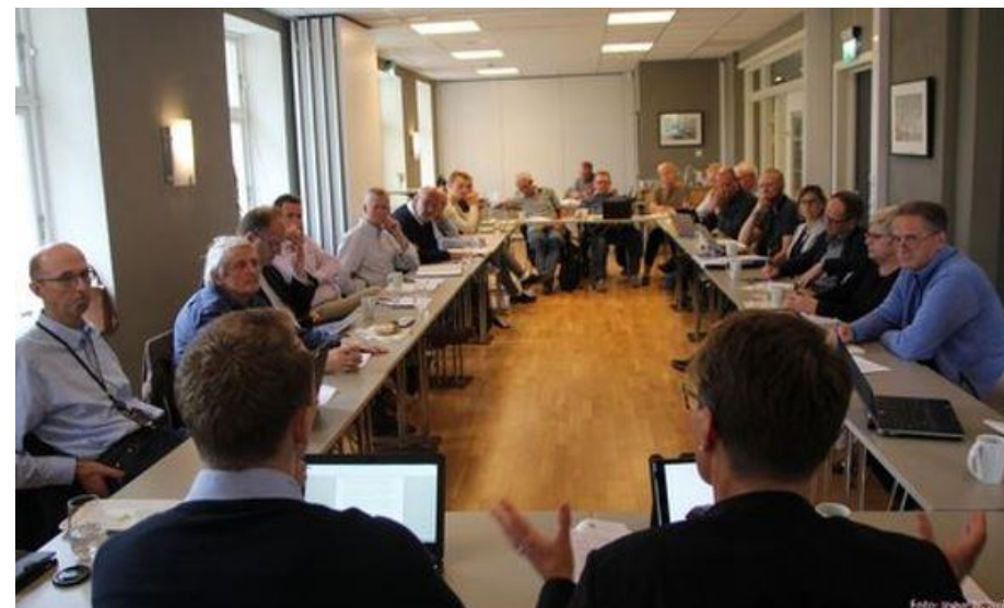
Rundebordskonferanse i 2016 om klimaarbeidet i Agder.