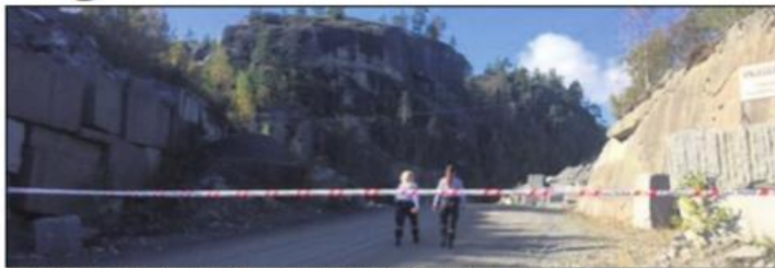
AVSPERRET: Hele området rundt steinbruddet i Tveidalen, der ulykken skjedde i oktober i fjor, ble raskt sperret av.

Ulykken der en ansatt mistet livet skjedde i Bjørndalen i Tveidalen 4. oktober i fjor. Selskapet opplevde så en ny ulykke i Malerød-bruddet 27. januar i år, der en ansatt ble alvorlig skadet. Denne saken er nå slå-