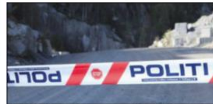
TVEIDALEN: Politiet har sperret av området der ulykken skjedde tirsdag.

Stedet der ulykken skjedde tirsdag ettermiddag er i dag sperret av på grunn av etterforskningen og på grunn av en minnestund som skal holdes på stedet.