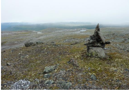
Elkem Nasa kvarts