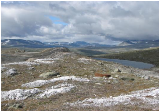
REC Solar Norway