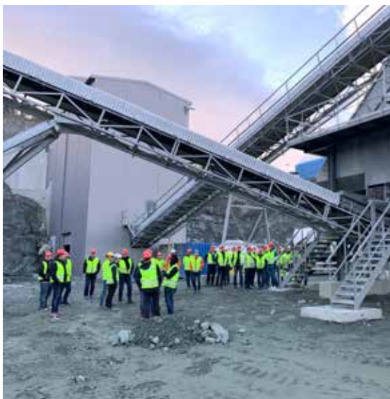
Ivrige deltagere på vedlikeholdsworkshop, her på befaring på Franzefoss Pukks anlegg «Lia».