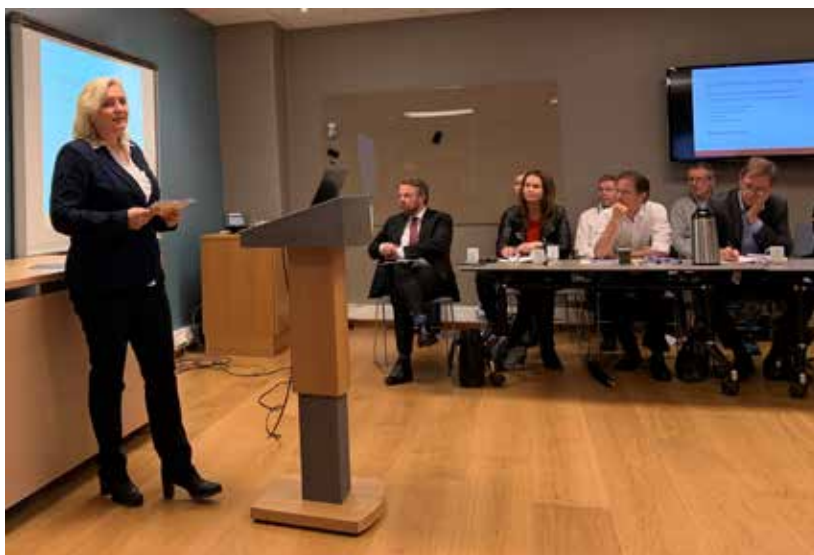
Innspillmøte om Bergindustrien 2. oktober i Nærings- og fiskeridepartementet.

I forbindelse med den pågående minerallovsevalueringen, var sekretariatet på besøk hos NFD for å gi våre innspill. Det er en del å ta tak i basert på Evalueringsutvalgets