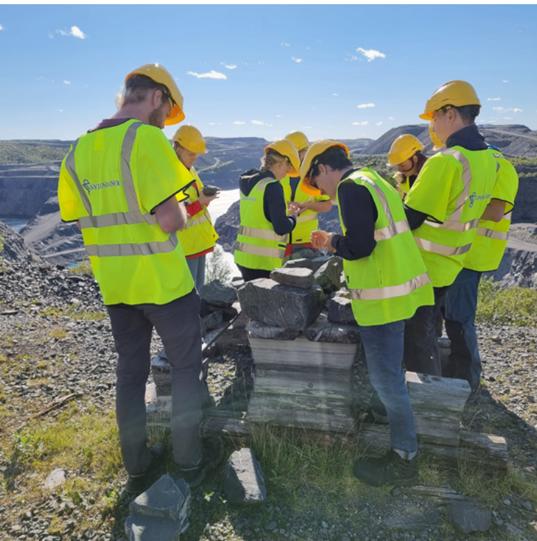
Traineesamling i Sydvaranger, Kirkenes august 2022

I 2022 kunne vi ønske tre nye traineer velkommen, ytterligere tre traineer starter på sitt andre år, mens en avsluttet 31. august etter sine to år.