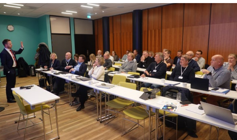
Fra innspillmøtet i november i fjor.