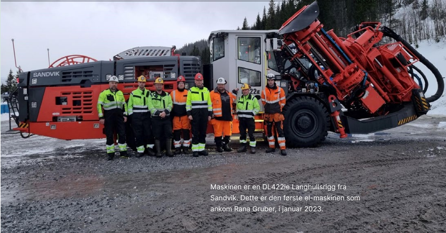
Maskinen er en DL422ie Langhullrigg fra Sandvik. Dette er den første el-maskinen som ankom Rana Gruber, i januar 2023.

På Bergindustridagene hadde vi flere innlegg om dette temaet hvor representanter fra UEPG, Asplan Viak og NCC snakket om viktigheten av å ta vare på det biologiske mangfoldet. Dette er noe som også medlemmene er svært opptatt av.