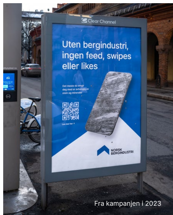
Fra kampanjen i 2023

Vår økonomiske situasjon er tilfredsstillende, og vi anser det derfor korrekt å avlegge årsregnskapet under forutsetning om fortsatt drift..