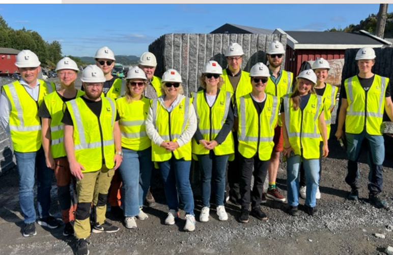
En blid gjeng på traineesamling

I september kunne vi ønske hele fire nye traineer velkommen. Samtidig startet to på sitt andre år, mens tre traineer hadde fullført den toårige ordningen.